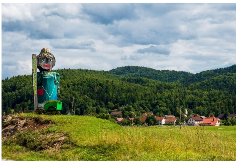
Slika 7: Babno Polje