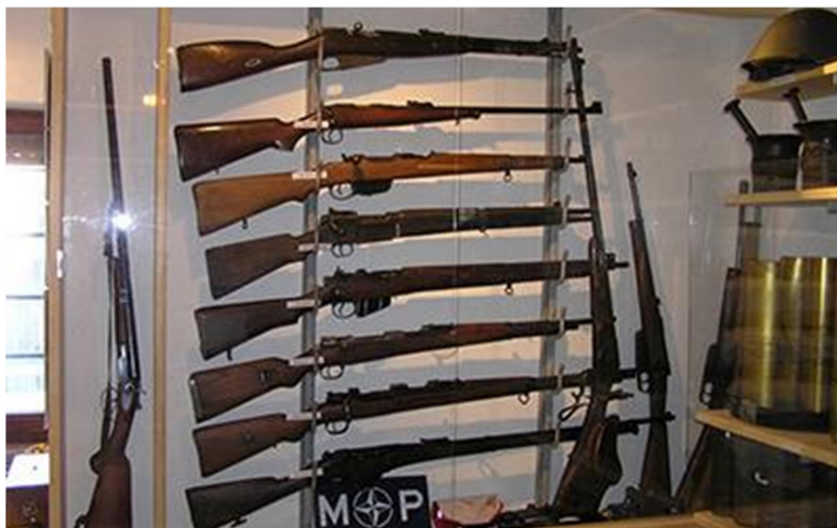
Slika 6: Orožje

(VIR: ( https://www.loskadolina.info/vojaski-kmecki-muzej-stanislav-pucelj.html ), 9.5. 2025)