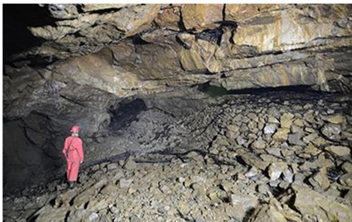
Slika 3: Golobina