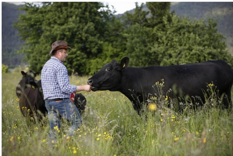
Slika 5: Posestvo Bajer