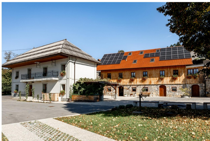
Slika 2: Ars Viva