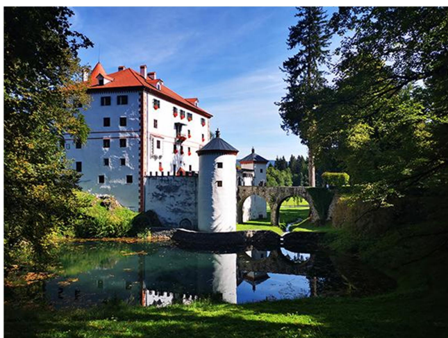
Slika 4: Grad Snežnik

(VIR: ( https://www.aktivna-druzina.si/grad-sneznik/ , 9.5. 2025)